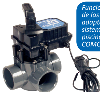
PE24VA con válvula* (*no se incluye la válvula)